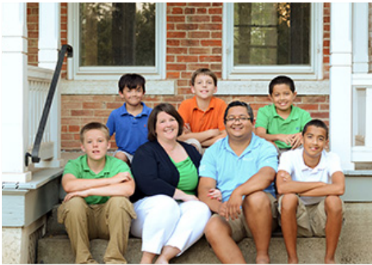
Familia anfitriona durante 3 años

Las familias americanas están deseando acoger a los españoles y compartir sus vidas con ellos. Hay familias más activas, menos activas y con diferentes estilos de vida, pero todos son encantadores y le enseñarán al estudiante como es la vida en USA. Es normal que el estudiante anfitrión participe en un deporte o tenga un trabajo, pero no le ocupará horas excesivas y durante ese tiempo otros miembros de la familia o amigos estarán con el estudiante español. Entre la vida familiar y las actividades que organiza Live 'n Learn los chicos disfrutarán de una experiencia completa.