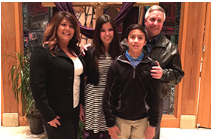
Familia anfitriona de Denver en 2016

Nuestros coordinadores locales hacen un trabajo muy delicado y laborioso buscando y asignando las familias anfitrionas. Nuestra intención es siempre entregar las familias entre dos semanas y cinco días antes de la salida, no obstante puede darse la circunstancia de que alguien reciba su familia uno o dos días antes de la salida. Os rogamos paciencia. No os preocupéis, vuestras familias serán maravillosas y nadie viaja sin familia. Sabemos que la espera de la familia es un momento estresante, pero os aseguramos que al final va a tener una buena familia.