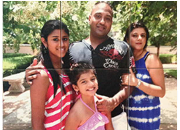
Una familia de Cincinnati de origen hindú

No obstante lo que os garantizamos es que son familias totalmente integradas en la comunidad , que no pertenecen a ninguna comunidad cerrada extranjera, que sus hijos estarán igualmente integrados, que serán angloparlantes y que el único idioma de la casa será el inglés . Puede que las familias conserven alguna tradición o algo de la cocina de su país de origen, pero eso no hace más que enriquecer la experiencia y abre las mentes de los chavales a más culturas.