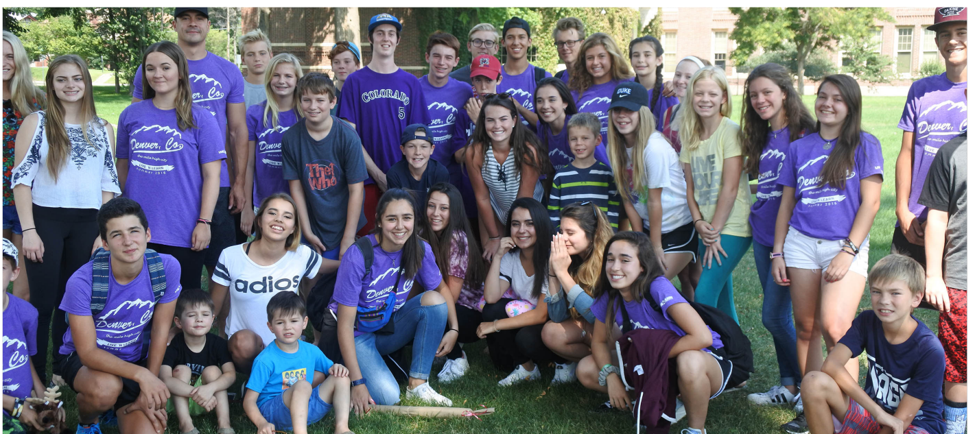
Estudiantes españoles y host families en Denver 2016