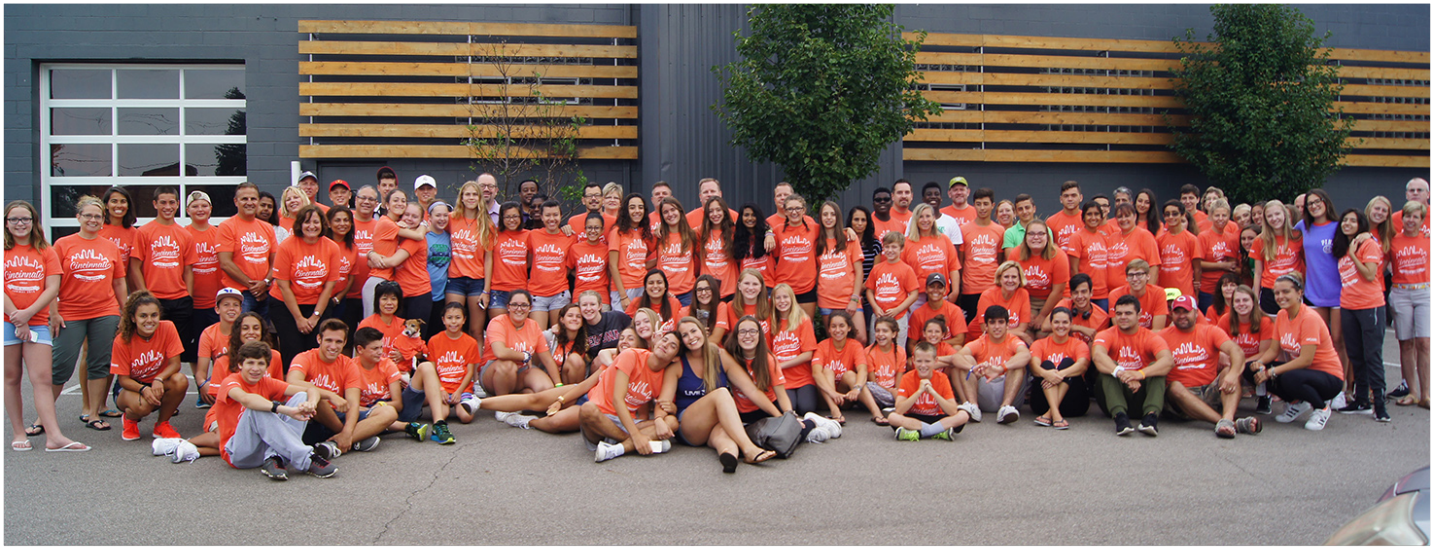
Estudiantes españoles y host families en Cincinnati 2016